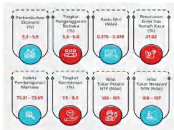
Gambar 3.2. Sasaran RKP 2023