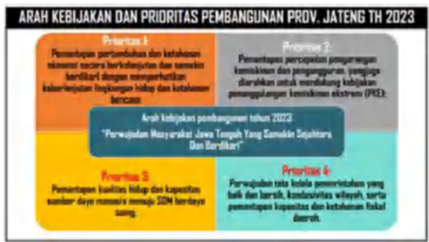
Gambar 3.3. Arah Kebijakan dan Prioritas Pembangunan Provinsi Jawa Tengah Tahun 2023

Rencana pembangunan daerah tahun 2023 juga untuk mewujudkan implementasi Program Unggulan Jawa Tengah yaitu :