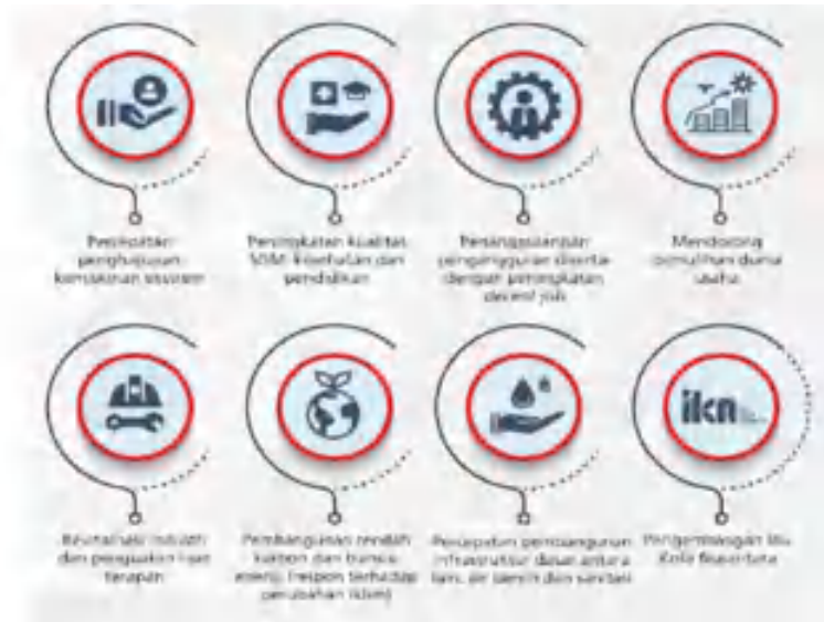
Gambar 3.1. Arah kebijakan RKP 2023

Sasaran Pembangunan pada Rancangan Rencana Kerja Pemerintah (RKP) Tahun 2023 adalah sebagai berikut: