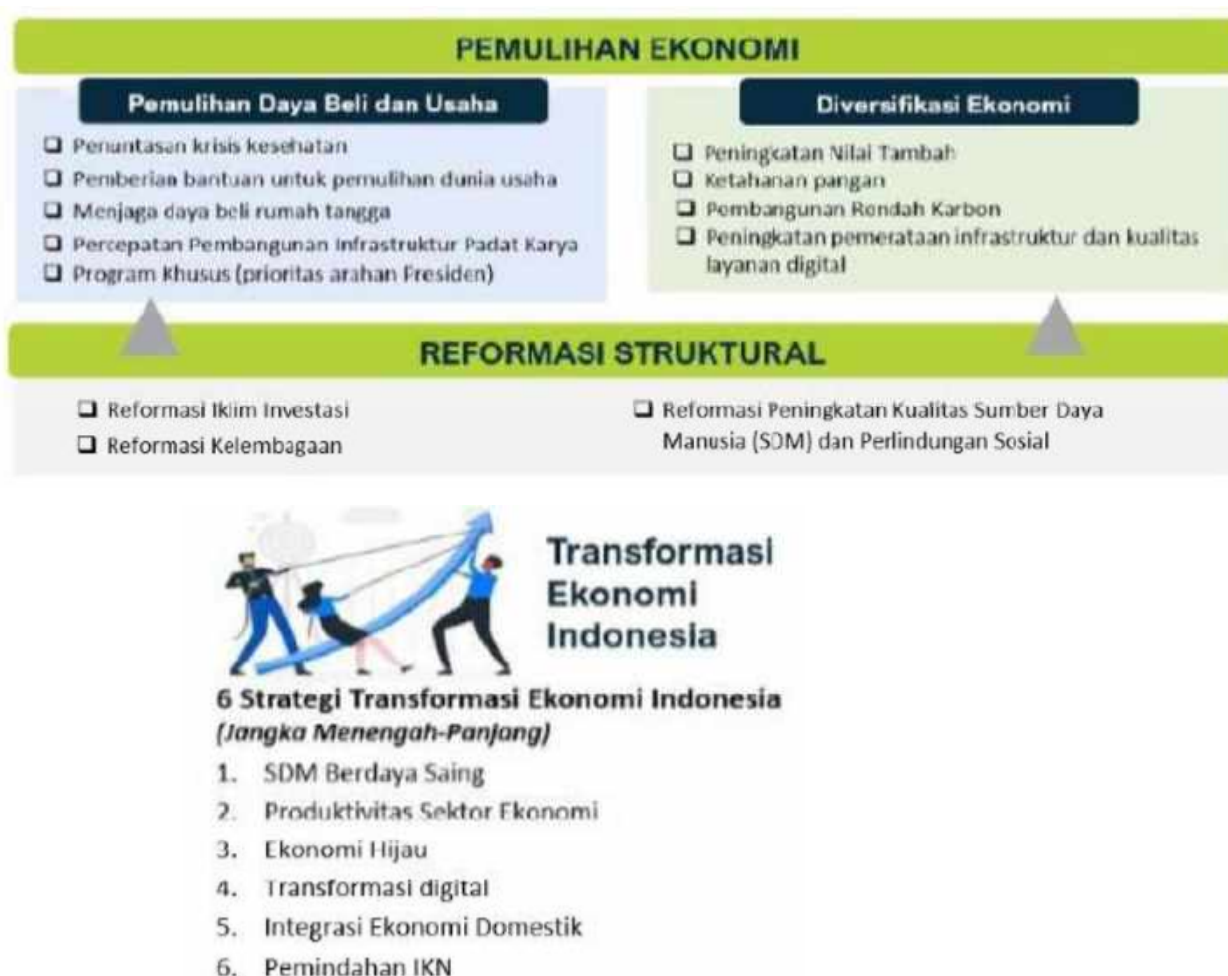
Gambar 3.1 Pemulihan Ekonomi dan Reformasi Struktural

Sedangkan untuk mendukung Tema Tersebut diatas pembangunan nasional diarahkan pada 10 (sepuluh) strategi dan fokus pembangunan yang meliputi :