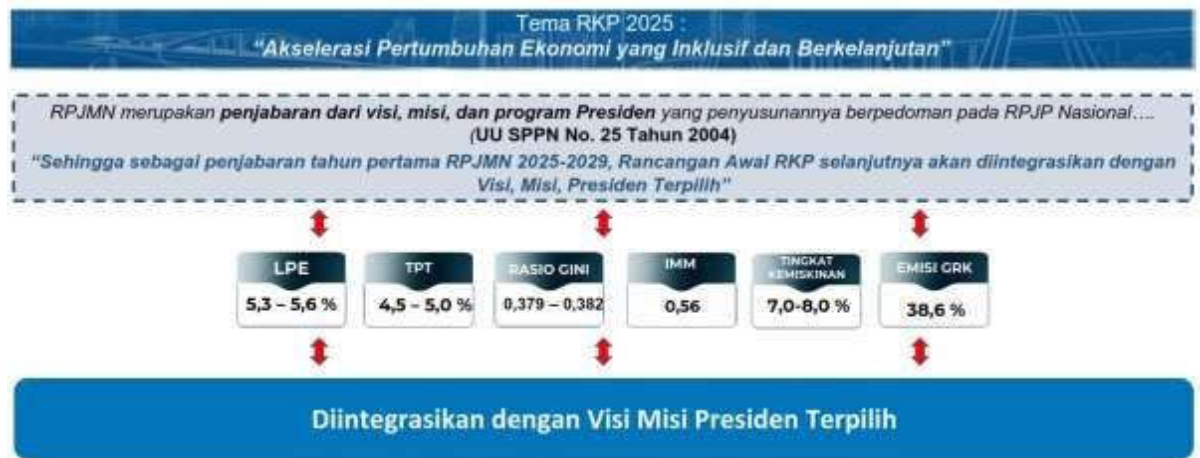
Gambar 3.1 Tema dan Arah Kebijakan RKP Tahun 2025

menurunkan ketimpangan dan menciptakan produk – produk yang ramah lingkungan.